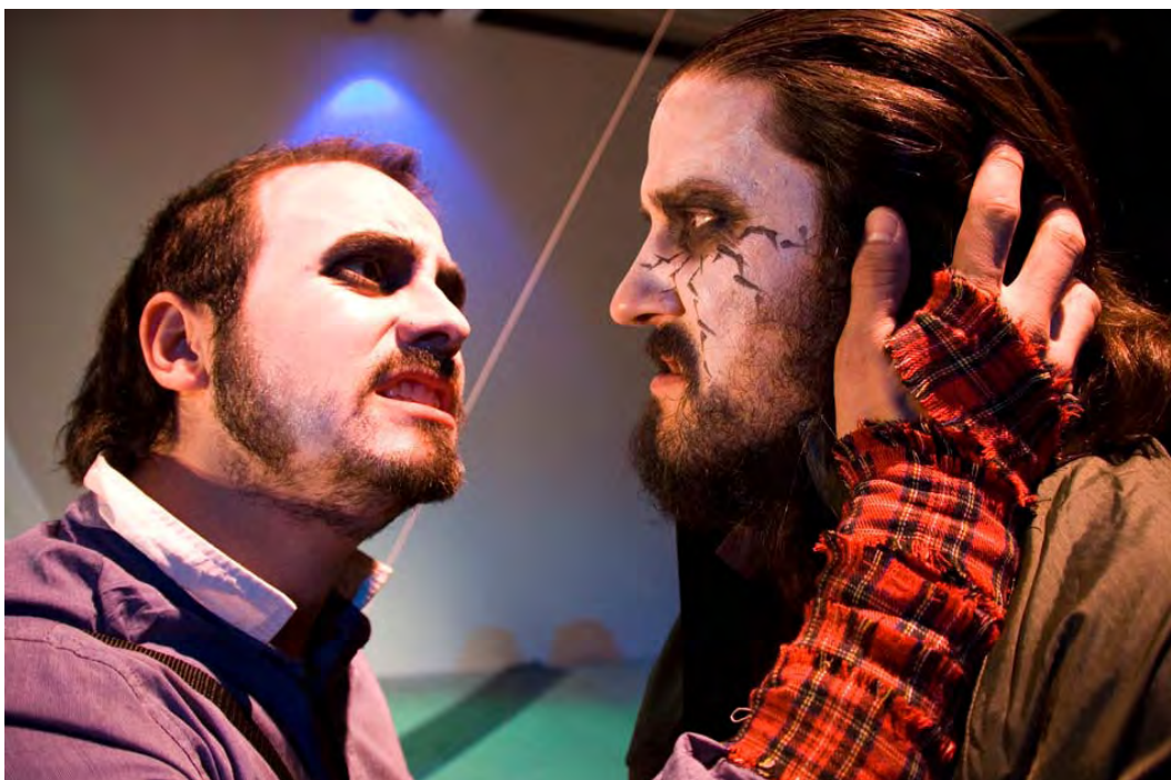
Macbeth y Malcolm