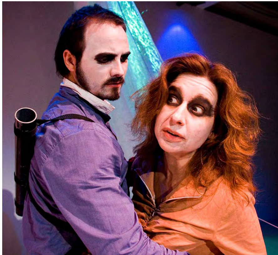
Macbeth y Lady Macbeth